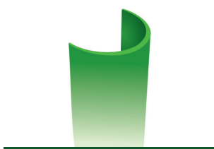
SECTION DU FIL