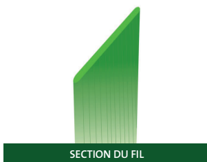
SECTION DU FIL